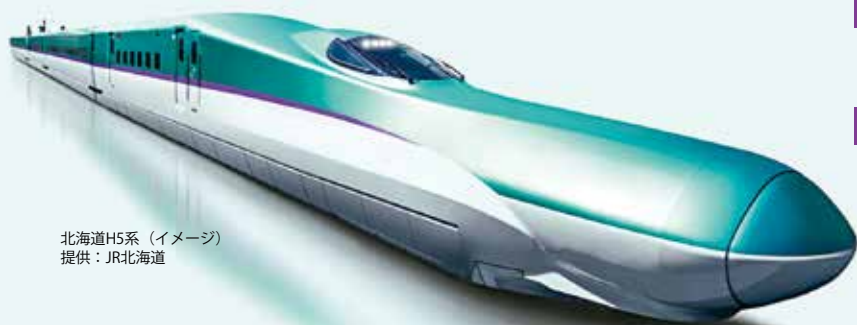
北海道H5系 (イメージ)