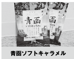
青函ソフトキャラメル