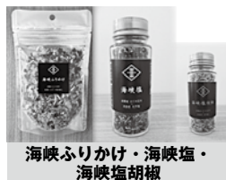
海峡ふりかけ・海峡塩・ 海峡塩胡椒