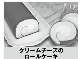
クリームチーズの ロールケーキ